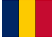
تشاد (اللاجئين السودانيين)